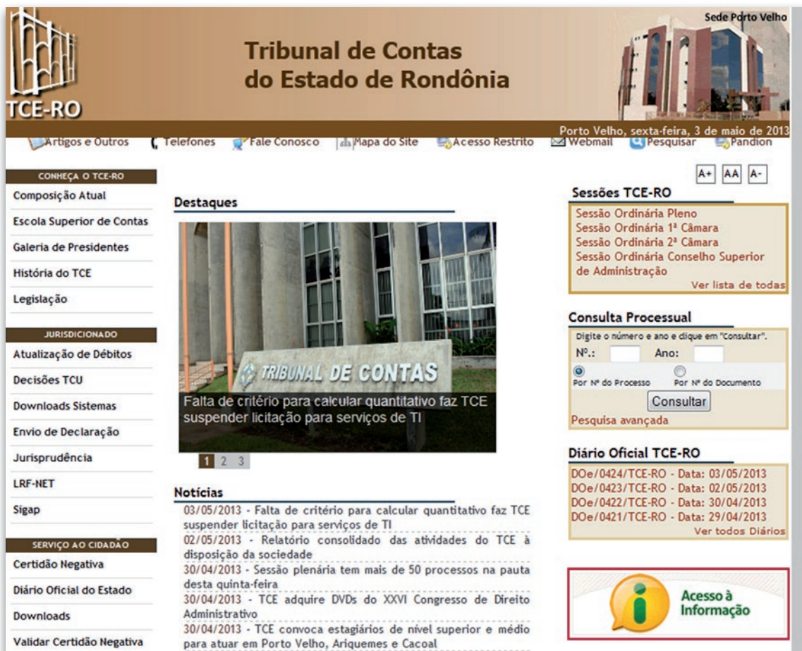
Figura 3 - Órgão do Estado de Rondônia: http://www.tce.ro.gov.br/