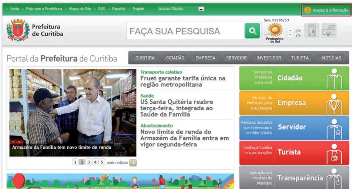
Figura 3 - Município de Curitiba: http://www.curitiba.pr.gov.br/