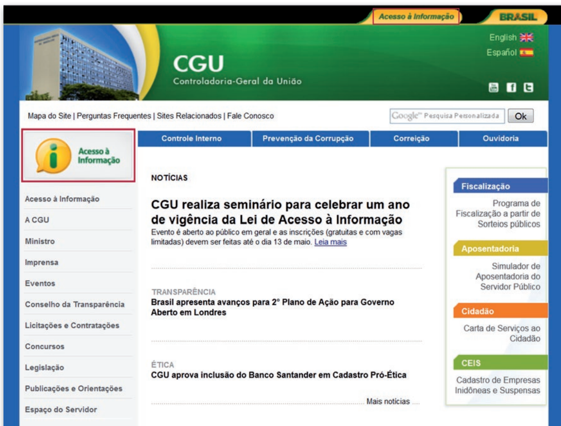
Figura 1 - Controladoria-Geral da União: http://www.acessoinformacao.rs.gov.br/

Além do acesso por meio de banner, o órgão/entidade também poderá inserir item de navegação no menu principal da página inicial de seu sítio eletrônico denominado “Acesso à Informação”. A figura abaixo ilustra o padrão para a disponibilização de banner e a criação de item de menu na página inicial dos órgãos/entidades federais.