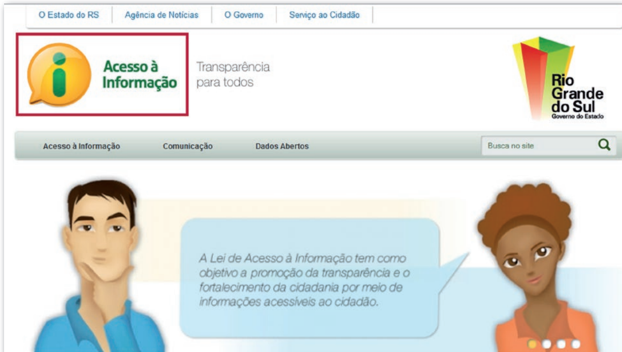
Figura 2 - Governo do Estado do Rio Grande do Sul: http://www.acessoinformacao.rs.gov.br/

A seguir, seguem exemplos de aplicação de modelos padrão para a criação de endereço eletrônico (URL) para divulgação do conteúdo sobre acesso à informação em órgãos/entidades estaduais e municipais: